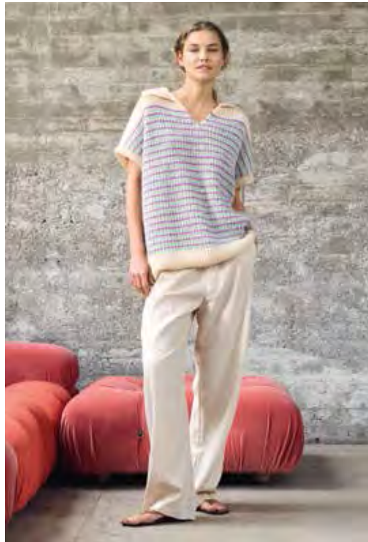
14 – SETASURI rechte Seite: 15 – POPCORN