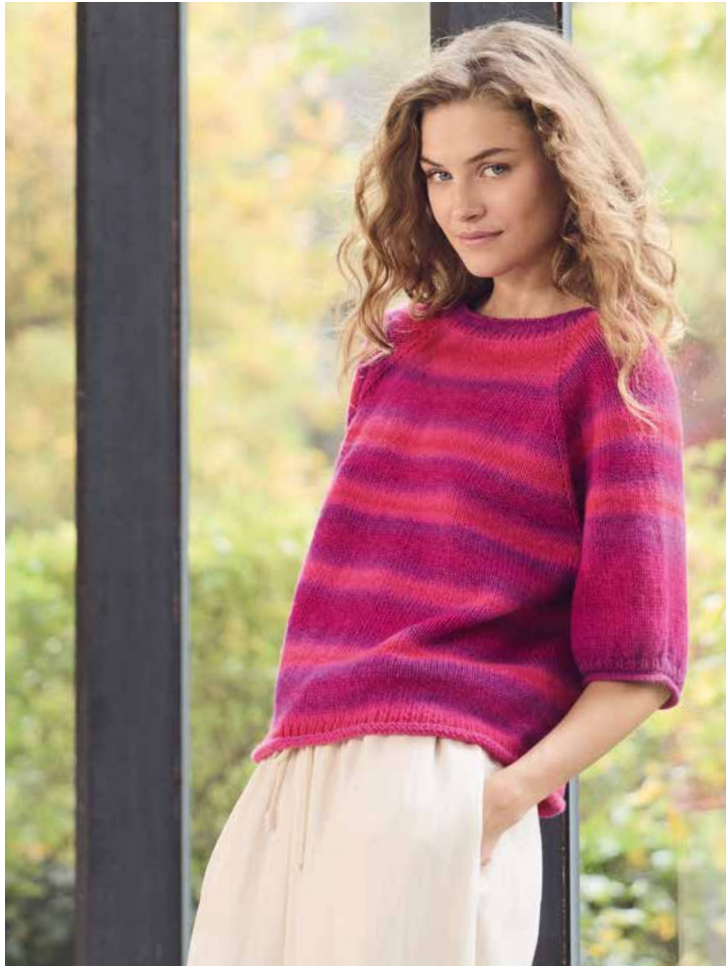
09 – CORALLO