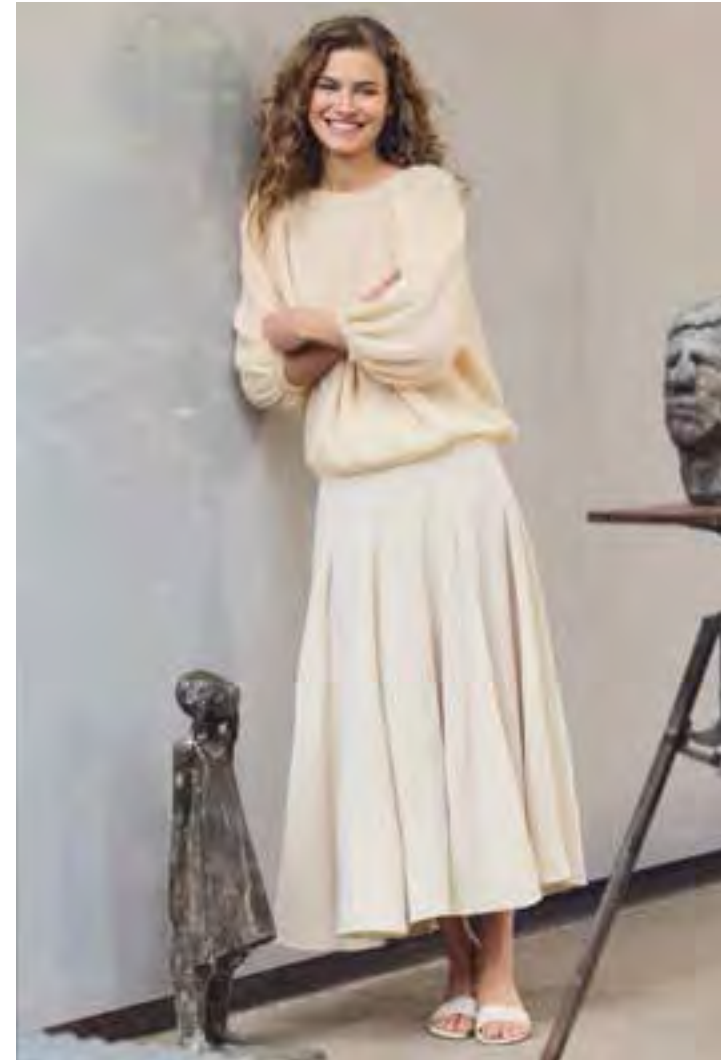
linke Seite: 18 – POPCORN | 19 – SETASURI