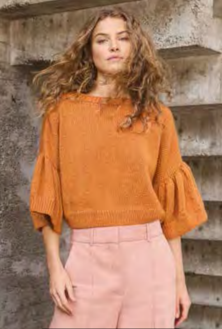
07 + 08 – SUMMER SOFTNESS