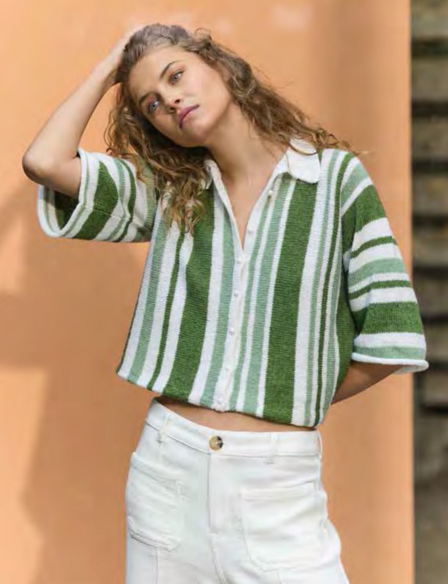
20 – ECOPUNO