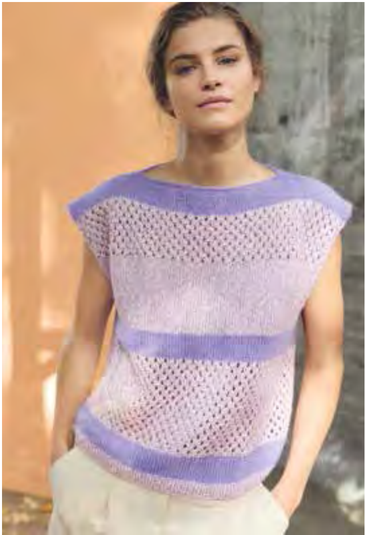
linke Seite: 23 – PER FORTUNA 24 – BOTTONI + SETASURI