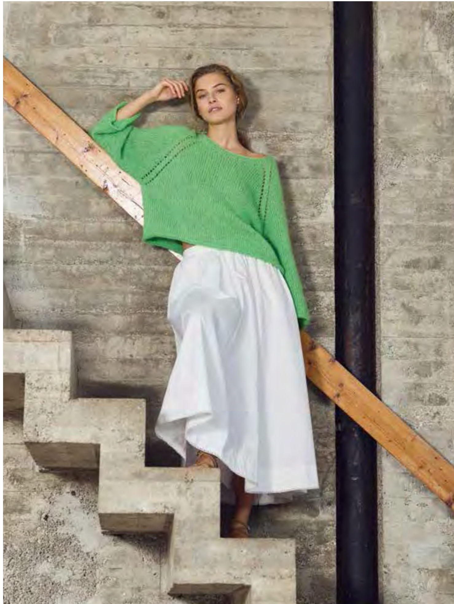
27 – SETASURI | rechte Seite: 28 – SOMMER SOFTNESS