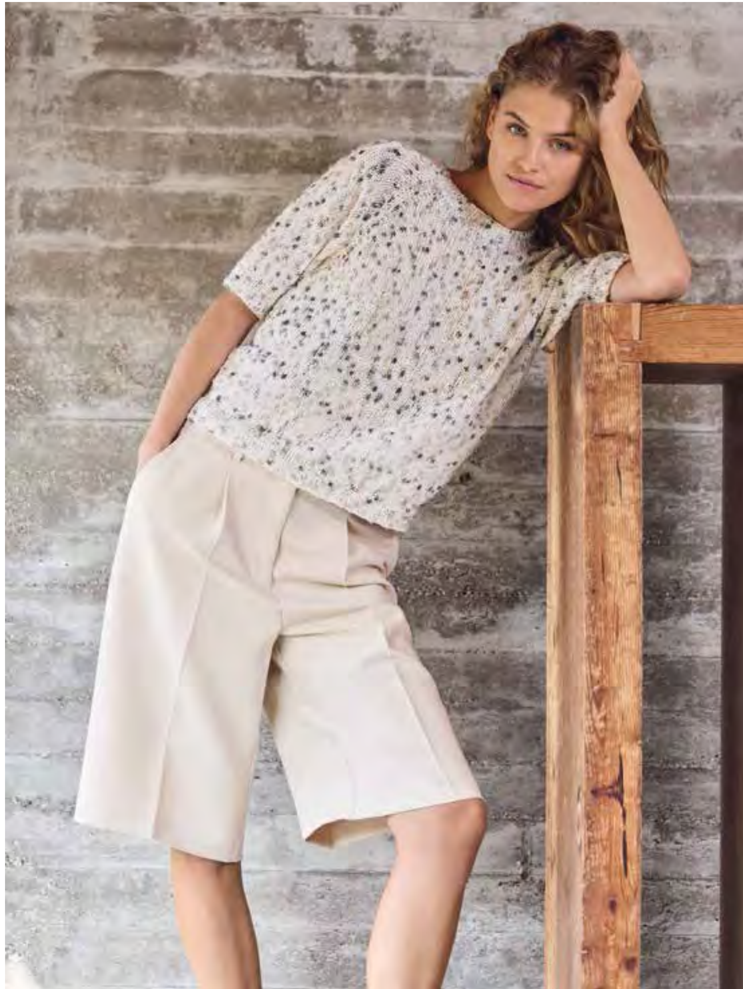
17 – POPCORN